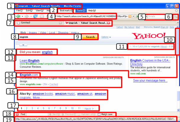
図 2: ブロックの例

実験時に記録した被験者の視線情報から, Results Page の表示が開始された時刻を基点にして 0.5 秒刻みで注視点を抽出する。その上で, Results Page を図 2 に示す 19 ブロック (1: タイトルバー, 2: ブックマーク, 3: ボタン, 4: アドレスバー, 5: ツールバー, 6: ツールバーボタン, 7: タブ, 8: クエリボックス, 9: 検索ボタン, 10: スクロールバー, 11: ヒット件数, 12: スペルチェック, 13: タイトル, 14: スニペット, 15: スポンサーリンク, 16: 関連検索, 17: 次のページ, 18: ページ内検索, 19: ステータスバー) に分割し, 各ブロックにどのように注視点が推移するかを分析する。