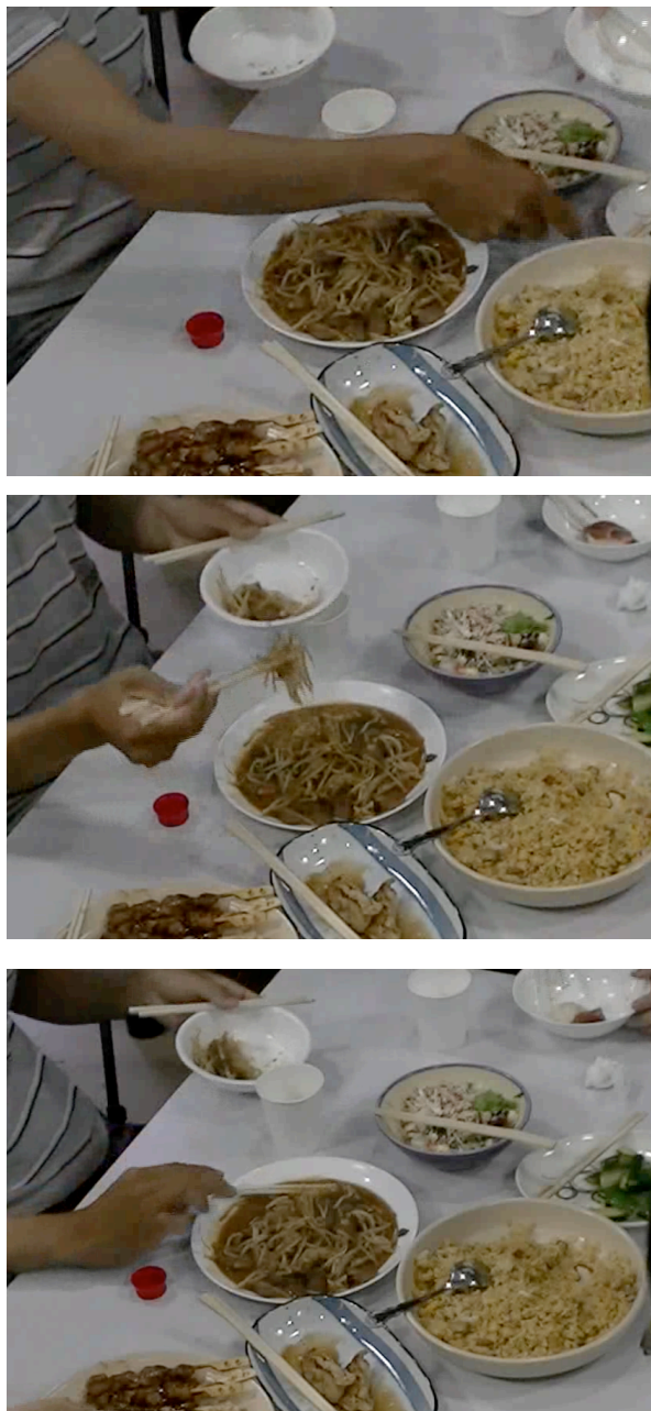
図1 取り分け行動の一連の動作

戻す一連の動作を取り分け行動としてラベル付けを行った。なお、一人が複数人に取り分けを行った場合には、まとめて一度とは見なさずに、一人につき、取り分け行動が一回起こったということにした。