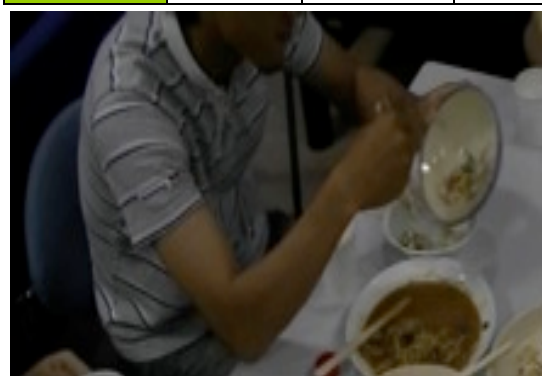
図 3 サラダ取り分け時の大皿の残量

並ぶ、すべての大皿料理に対する取り分け行動をみた場合、活発および停滞、停止の状況が個々の大皿料理に対する場合と異なることが予想できる。そこで、食卓に並ぶすべての大皿料理に対する取り分け行動の活性度をみるため、分析対象である 3 グループの全大皿料理に対する取り分け行動間の平均時間を算出した。その結果を表 5 に示す。